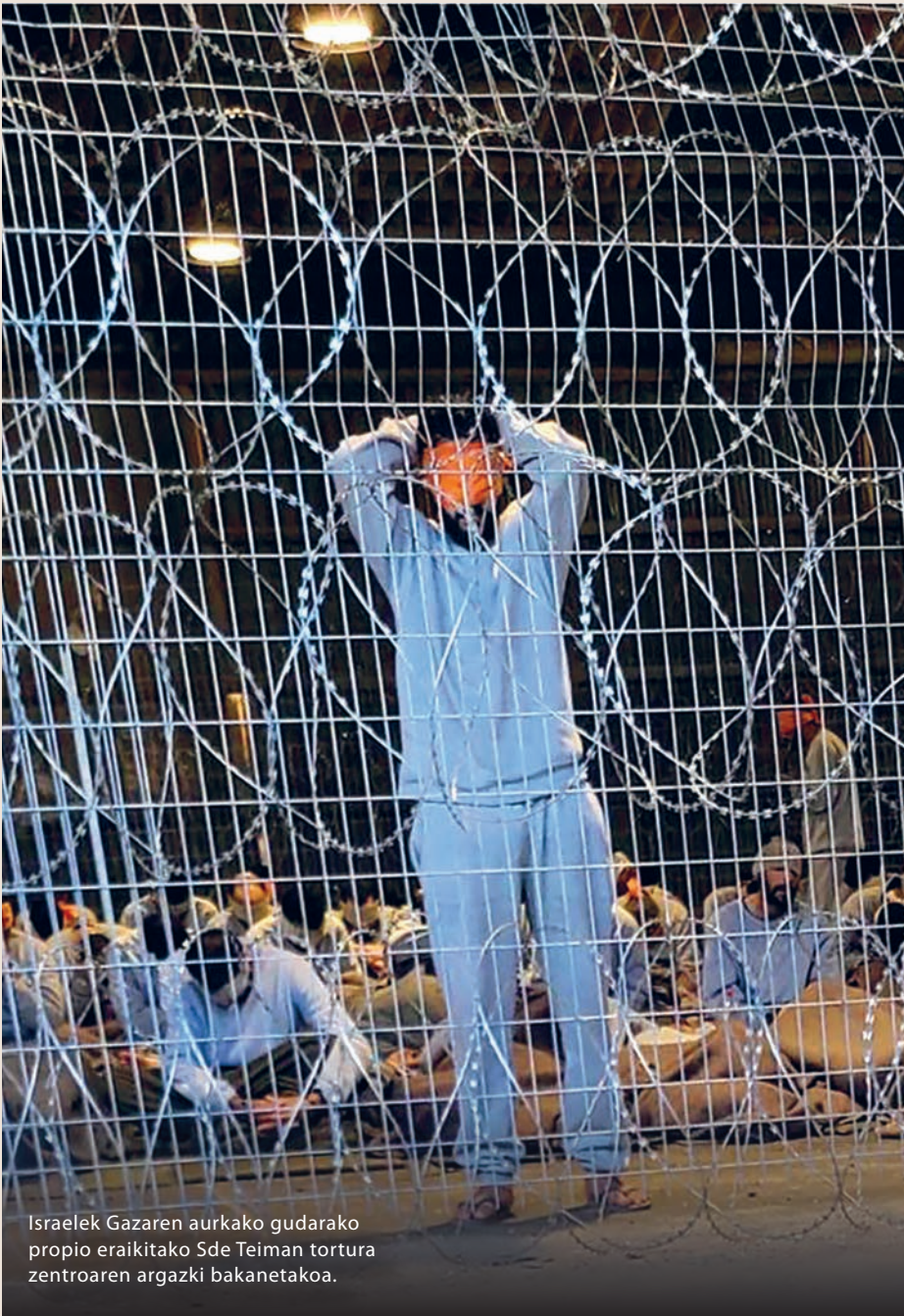
Israelek Gazaren aurkako gudarako propio eraikitako Sde Teiman tortura zentroaren argazki bakanetakoa.

orduan edo ezjakintasun sakonean murgilduta zaude –ez litzateke harriztekoa ikusita Israelgo erregimen despotikoak palestinarrei egiten dienaz dagoen jarreraipen mediatiko falta–, edo negazionismo sakonean zaude.